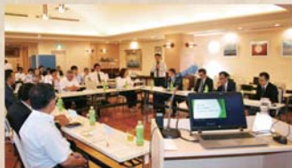
第2回 ジビエ研究会(令和元年10月)