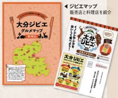
▶ ジビエマップ 販売店と料理店を紹介